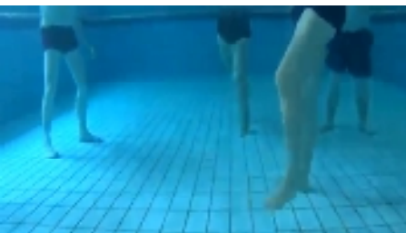
Unterwasser-Szene vom Bewegungsbad

Noch ganz offen steht die Weiter- führung der Wassergymnastik im Bewegungsbad gleich nebenan in der Kopfklinik, wofür mittlerweile