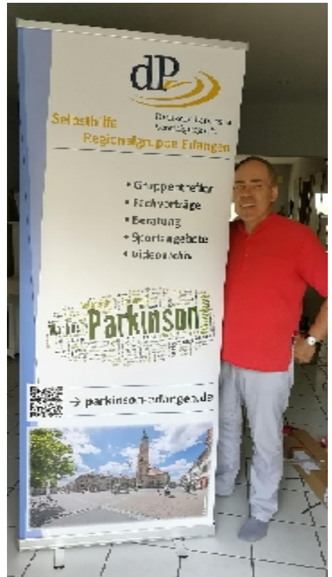
Das neue Rollup der Regionalgruppe

Das 35-jährige Jubiläum gab den Anstoß, nach einem repräsentativen „Blickfänger“ für diese und andere Veranstaltungen wie Parkinson- oder Senioren-Tage oder auch nur als Identitätsstiftendes Statement für unsere Selbsthilfetreffen Ausschau zu halten.