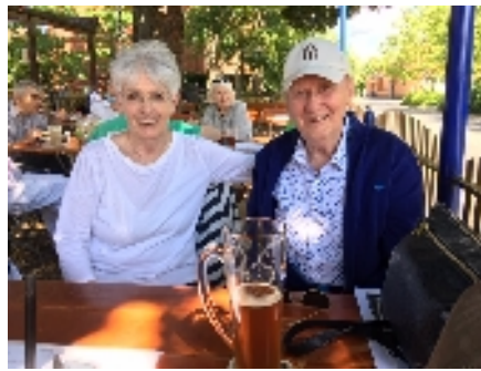
Beste Stimmung im Unicum-Biergarten

Mit dem Wetter hätten wir's nicht besser treffen können am 1. Juli, als wir aus der Not der fehlenden Hygienekonzepte für Innenräume kurzerhand eine Tugend machten und zum ersten Gruppentreffen nach 3monatiger Zwangspause in den schattigen Unicum-Biergarten eingeladen hatten. Zwei Dutzend strahlende Gesichter u. angeregte Gespräche gaben ein deutliches Zeugnis, wie sehr die Treffen allen gefehlt hatten.