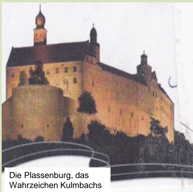
Die Plassenburg, das Wahrzeichen Kulmbachs